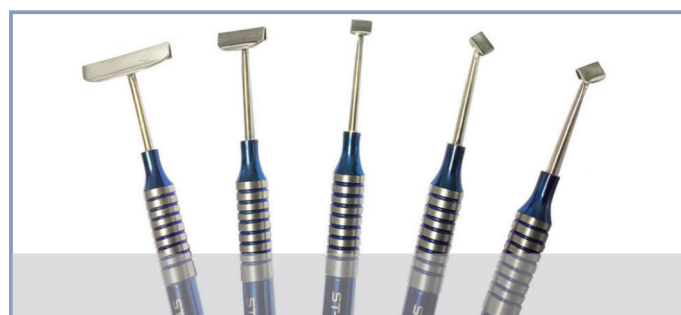
Набор Soft Brushing kit состоит из 5 инструментов разного размера и наклона рабочей части