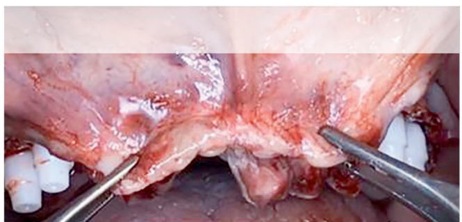
Надкостница и мягкие ткани растянулись и могут быть ушиты без натяжения