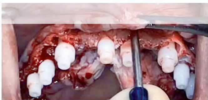
С помощью мягких поглаживающих движений в течение 2-3 минут надкостница растягивается